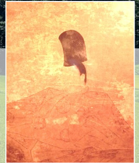
後鳥羽院御影写 隠岐神社所蔵

開催日：5/21(土) ※予備日5/22(日) ※少雨決行・荒天中止(中止時は2日前15:00までに決定)